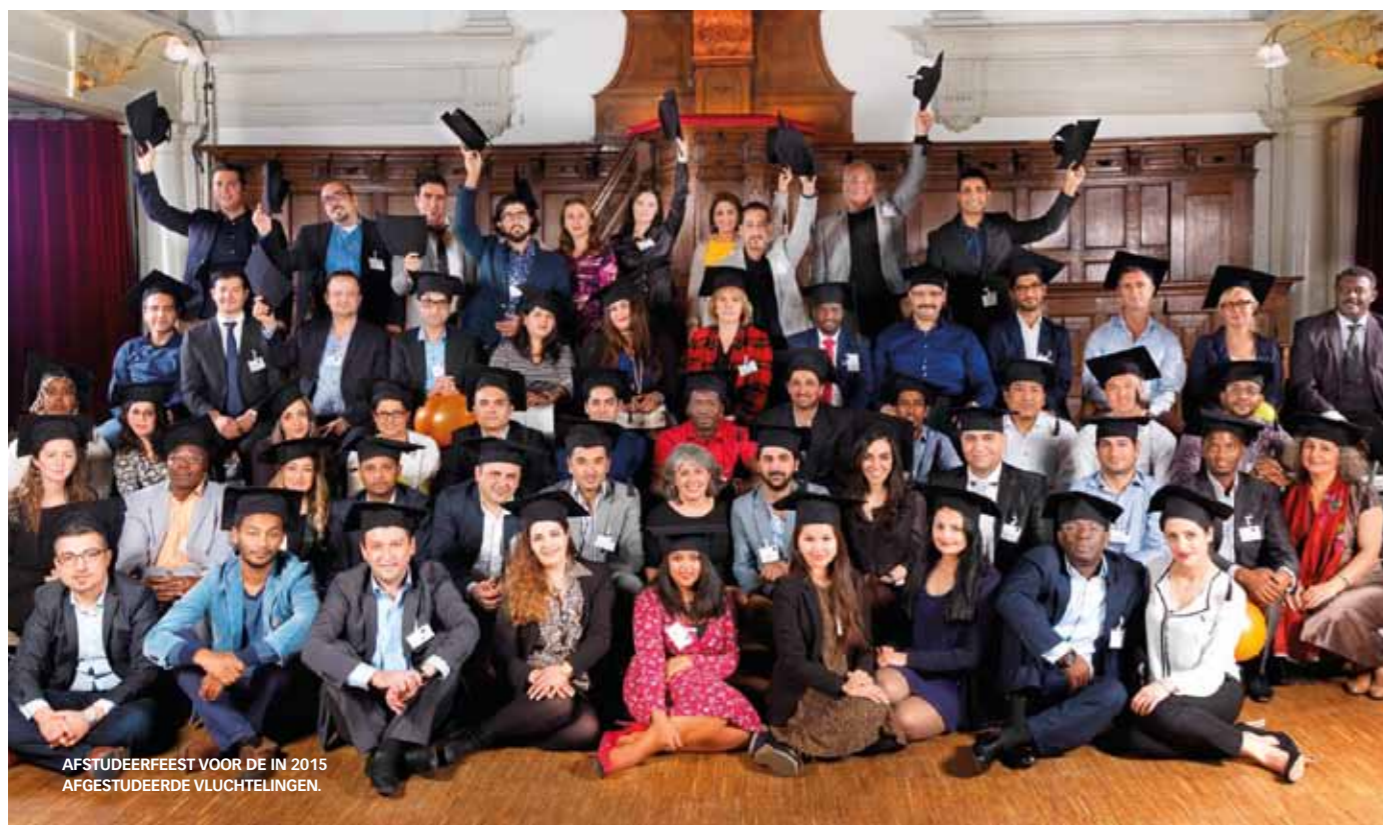
AFSTUDEERFEEST VOOR DE IN 2015 AFGESTUDEERDE VLUCHTELINGEN.